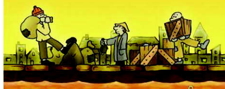
Banchina di carico

Metti 3 merci standard nella riserva del gioco e prendi 3 merci standard a tua scelta escluso il ferro. Metti 3 merci trasformate nella riserva del gioco e prendi 3 merci trasformate a tua scelta escluso l'acciaio.