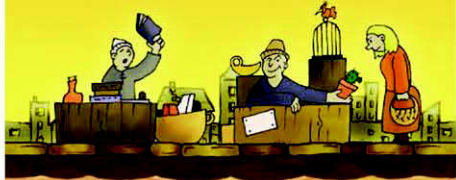
Mercato delle Pulci

Prendi le merci da uno spazio offerta che ne contiene 2 (o i franchi se sono 2) e le merci di tutti gli altri spazi offerta che ne contengono 1 (o 1 franco)