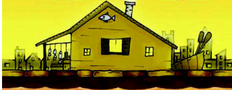
Casa del Pescatore

La Manifattura terrecotte è costruita dalla città ma può essere comprata