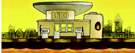
Impianto di Bio-Combustibile

Il proprietario può pagare l'energia richiesta per la spedizione delle merci attraverso la Compagnia Marittima, con il grano. Ogni grano vale 2 Energie (nessuna azione edificio)