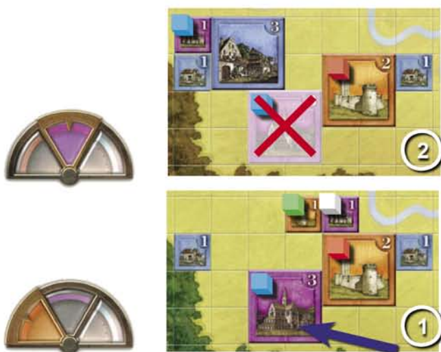
Il Monastero del giocatore blu costruito nell'era del Potere, non si propaga nell'era della Fede perchè violerebbe in questa era la regola del Dominio che proibisce che un edificio Militare o Religioso unisca due Domini.

La regola della Gerarchia non si applica.