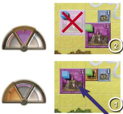
Il Monastero del giocatore blu costruito nell'era del Potere, non si propaga nell'era della Fede perchè violerebbe la regola della Gerarchia che prevede che l'edificio Religioso o Militare più grande sia unico nel dominio.

• Se un edificio Militare o Religioso, costruito nell'era del Potere viola le regole Gerarchiche nell'era della Fede, l'edificio non proietta le ombre del tempo e non viene propagato. In questo caso l'era della Fede sovrasta quella del Potere.