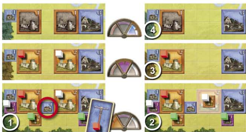
Il giocatore rosso costruisce un Borgo e così facendo unisce due Domini nell'era del Potere. Nel nuovo Dominio sono presenti due Mura e questo è contrario alle Regole Gerarchiche.

La propagazione nel tempo di un edificio Civile può unire (C-a Unione di Domini) o dividere (C-d Divisione dei Domini) due Domini nella stessa era. Le implicazioni Gerarchiche di tutte le propagazioni debbono essere tenute in considerazione.