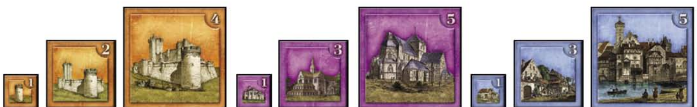
Torre di Guardia Mura

Le tessere Mura, Castello, Monastero e Abbazia hanno sul retro il disegno dello stesso edificio ma in rovina.