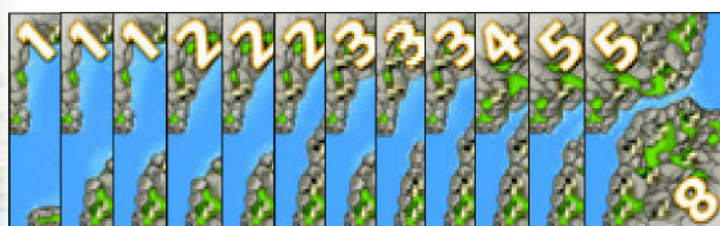
12 Carte Collina con Valori da 1 a 8