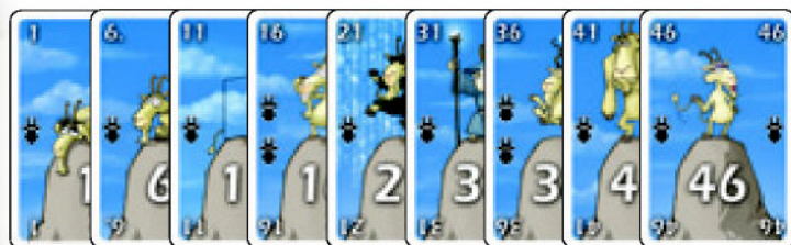
50 Carte Capra con Simboli da 1 a 5